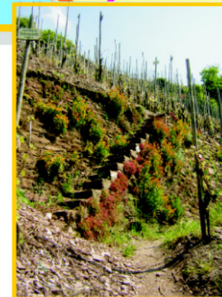
Der Geo-Garten Das Wunder der Steine